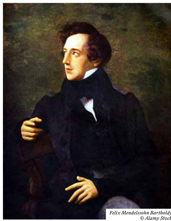
Felix Mendelssohn Bartholdy

Das Konzert «Klavier & Co: Mendelssohn Klaviermusik» am 5. Dezember im Haus der Musik Innsbruck bietet eine wunderbare Gelegenheit, Mendelssohns Klavierkunst in ihrer ganzen Bandbreite zu erleben. Die Auswahl der Werke verspricht einen Einblick in die poetische Tiefe und technische Raffinesse seines Schaffens. Dabei entfalten sich intime Klangräume, die Mendelssohns feines Gespür für musikalische Dialoge und emotionale Nuancen offenbaren. Das Konzert würdigt damit nicht nur einen großen Komponisten, sondern auch einen musikalischen Humanisten, dessen Werk bis heute berührt und inspiriert.