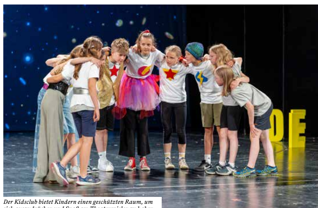
Der Kidsclub bietet Kindern einen geschützten Raum, um sich auszudrücken und Spaß am Theaterspielen zu haben.