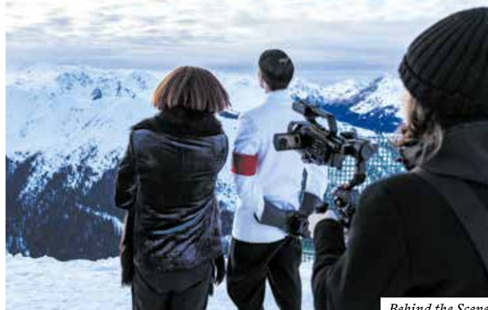
Behind the Scene.

gleichnamigen Film von Ernst Lubitsch aus dem Jahr 1942 probt eine Handvoll Schauspiel:innen den Aufstand wider das nationalsozialistische Regime. Ob der Aufstand gelingt, wird sich weisen. Fest steht (damals wie heute): Heilt Hitler! Und alle faschistischen Führer dieser Welt!