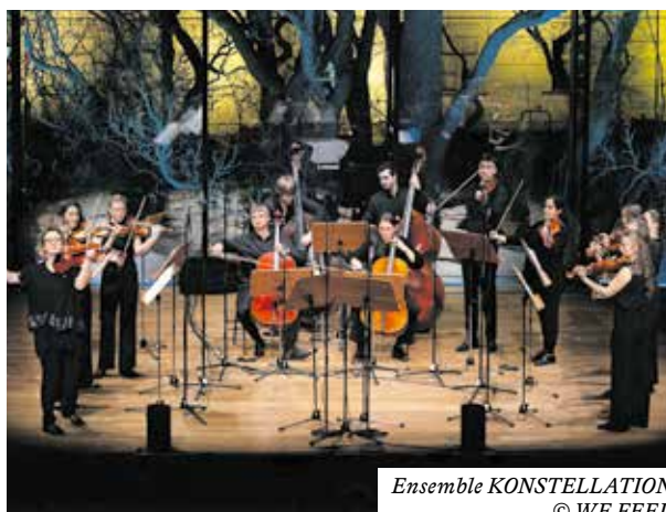
Ensemble KONSTELLATION