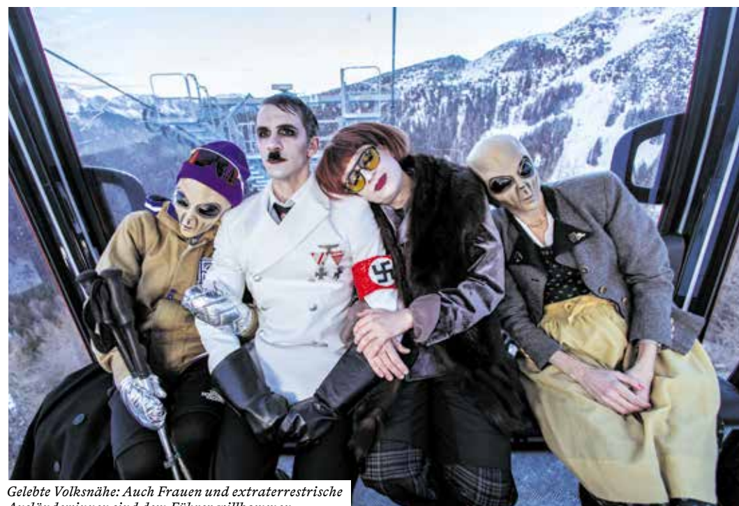
Geliebte Volksnähe: Auch Frauen und extraterrestrische Ausländer:innen sind dem Führer willkommen.

gleichnamigen Film von Ernst Lubitsch aus dem Jahr 1942 probt eine Handvoll Schauspiel:innen den Aufstand wider das nationalsozialistische Regime. Ob der Aufstand gelingt, wird sich weisen. Fest steht (damals wie heute): Heilt Hitler! Und alle faschistischen Führer dieser Welt!