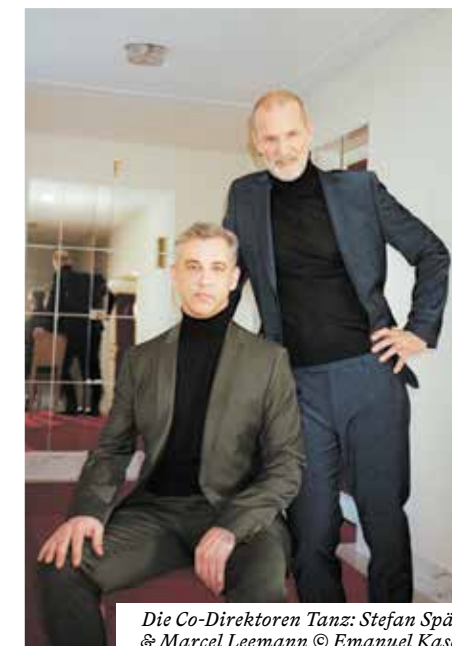
Die Co-Direktoren Tanz: Stefan Späti & Marcel Leemann

«Freuen Sie sich auf das wohl berühmteste Tanzstück überhaupt zu Tschaikowskis zauberhafter, mitreißender Musik.»