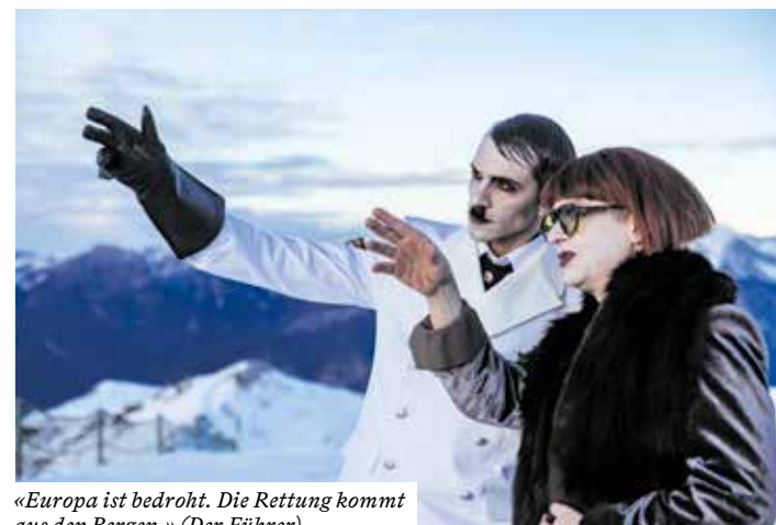
«Europa ist bedroht. Die Rettung kommt aus den Bergen.» (Der Führer)