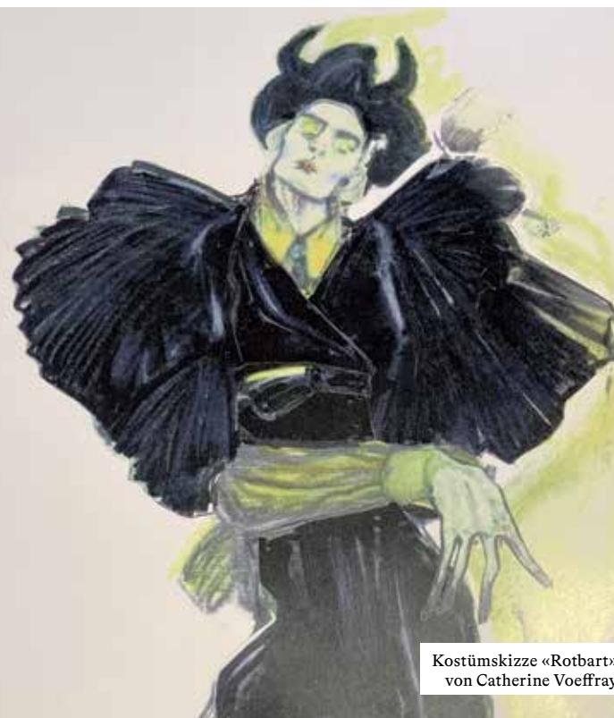
Kostümskizze «Rotbart» von Catherine Voeffray

Tanzstück mit Musik von Pjotr I. Tschaikowski