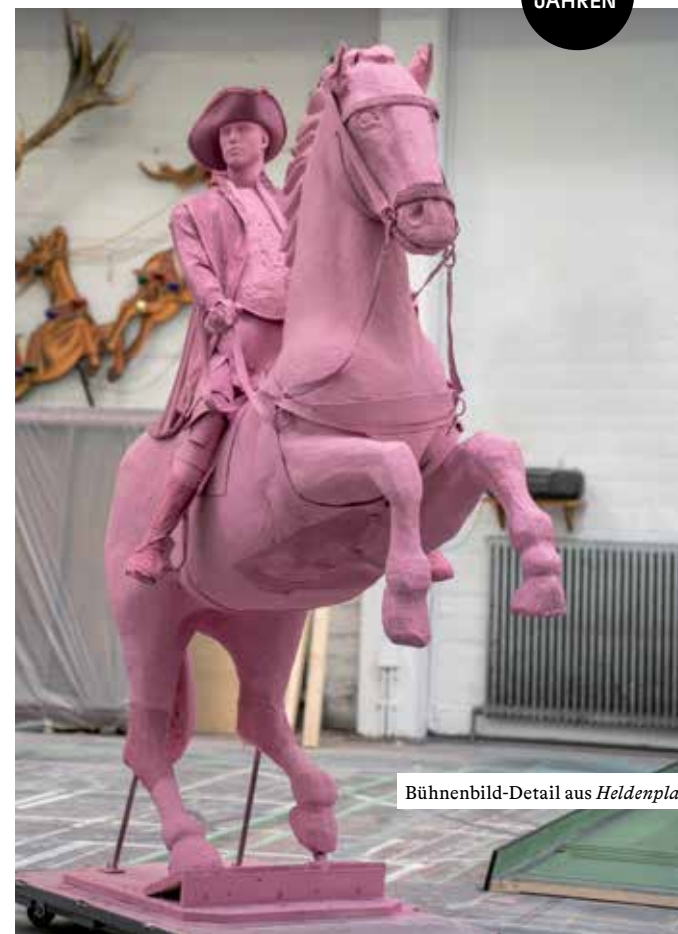
Bühnenbild-Detail aus Heldenplatz