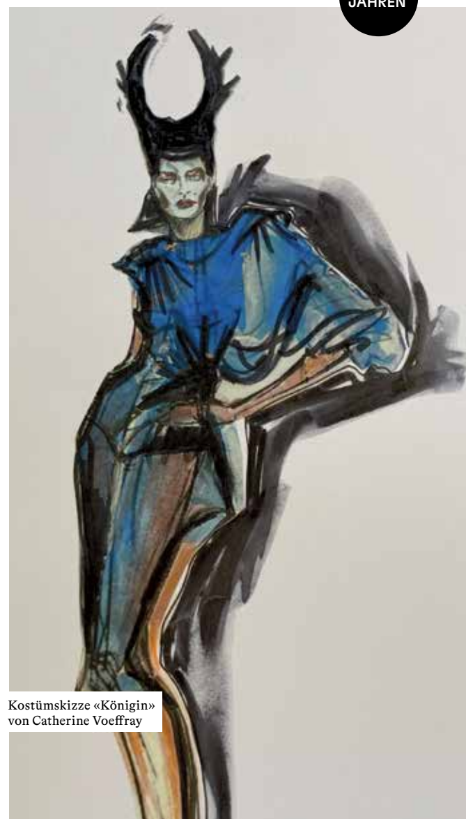
Kostümskizze «Königin» von Catherine Voeffray