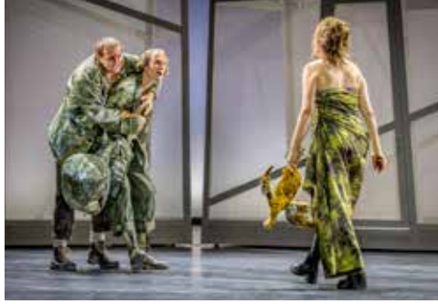
KONFERENZ DER ABWESENDEN 20.00 Uhr / Kammerspiele / Abo L1 / Preis KG FIGHT CLUB TIROL Die Talkshow mit Wumms 20.30 Uhr / [K2] / Preis KA