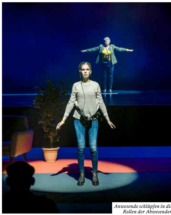
Anwesende schlüpfen in die Rollen der Abwesenden